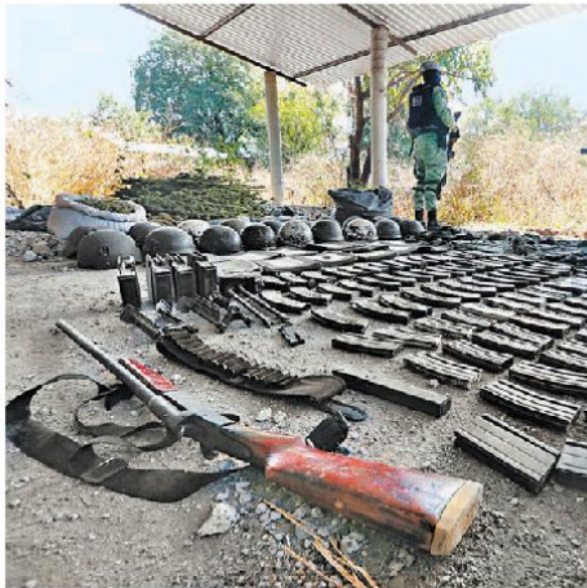
Aseguramiento en Michoacán en 2022.