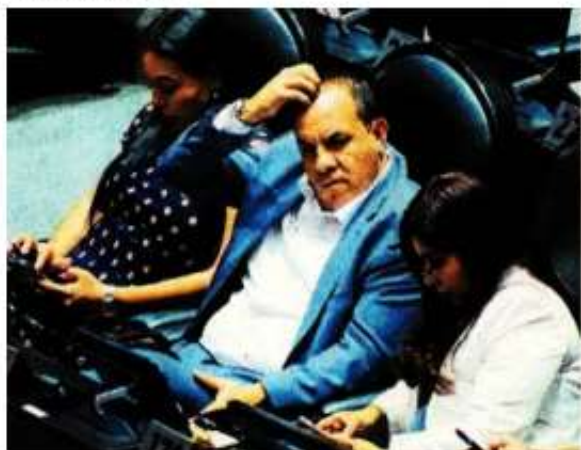
El exgobernador Cuauhtémoc Blanco acumula una serie de denuncias por presuntos desvíos de recursos.

Cabe resaltar que la Auditoría Superior de la Federación dará a conocer en el mes de octubre las primeras fiscalizaciones correspondientes a 2024, del que Cuauhtémoc Blanco Bravo gobernó durante ocho meses. ●