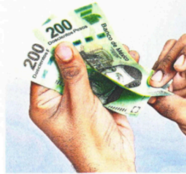
Desde que comenzó abril, el peso acumula una ganancia de 5% y cerró el viernes en 19.50 unidades.

Federal (Fed), es decir, una postura sesgada a bajar sus tasas de interés, contra un descuento para el Banco Central Europeo, que por ahora luce más asequible, dijeron los expertos de Banorte.