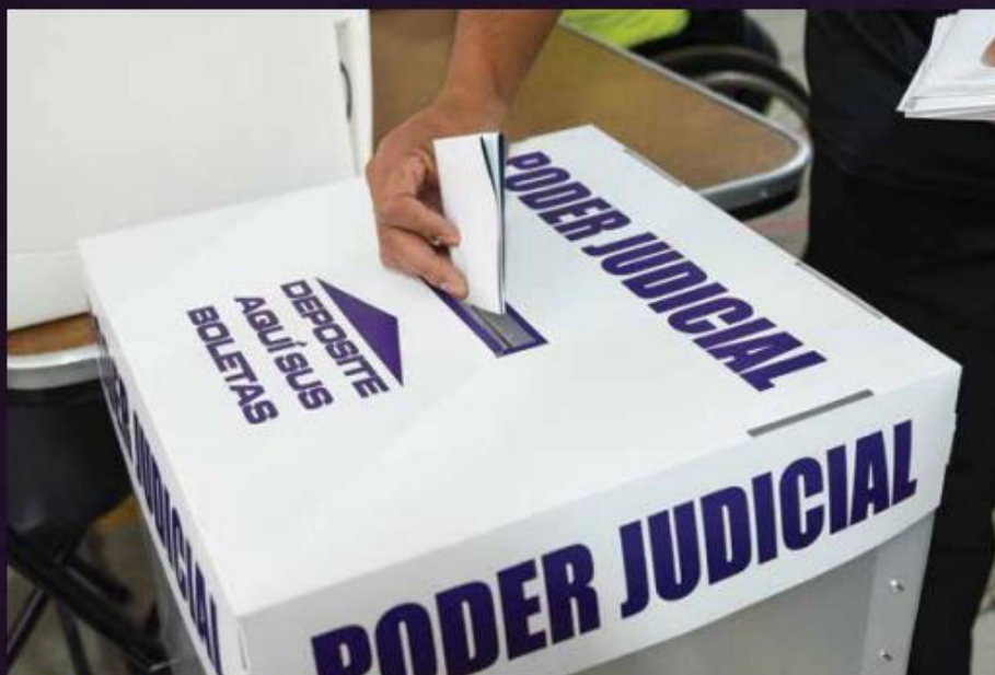
La participación real de los ciudadanos se verá en las urnas el próximo domingo 1 de junio.

Esto lo explica en parte porque el proceso de elección judicial ha sido tan complejo como barroco, "pero también se debe a la premura de la aprobación de la normatividad. Por un lado, que es una reforma constitucional, y el Poder Legislativo no cum-