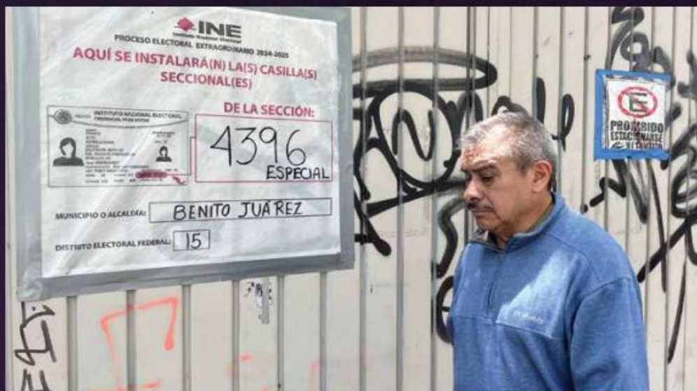
Las casillas están preparadas para la jornada. Se instalarán más de 80 mil.