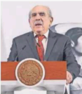
Pablo Gómez, titular de la Comisión Presidencial para la Reforma Electoral.

Aclaró que no está construida en las opiniones o desacuerdos de personas en lo individual. Al referirse al contenido de la iniciativa, la Mandataria federal afirmó que el planteamiento se