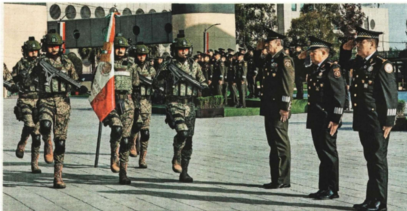
Ceremonia en la Plaza de la Lealtad, en la que se oficializaron los nombramientos.