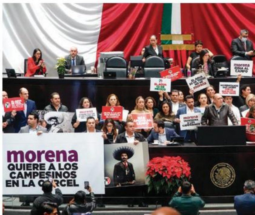
DIPUTADOS del PRI protestan desde el pleno contra el dictamen, ayer.