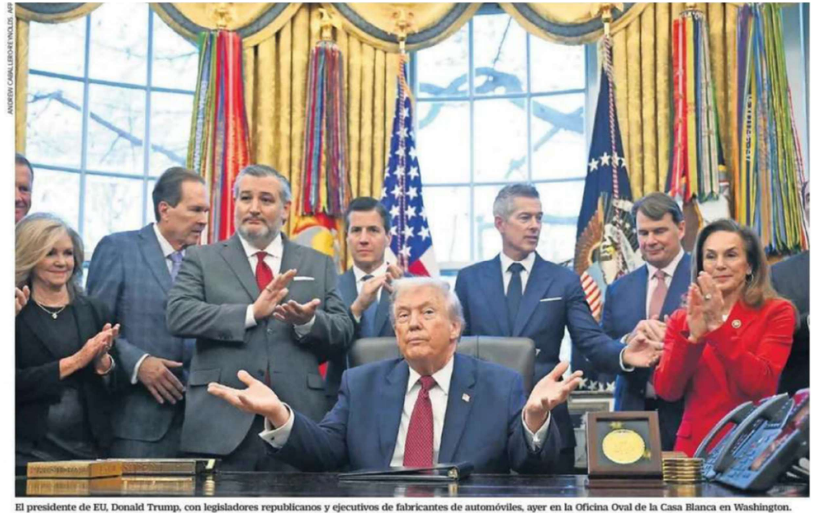
El presidente de EU, Donald Trump, con legisladores republicanos y ejecutivos de fabricantes de automóviles, ayer en la Oficina Oval de la Casa Blanca en Washington.