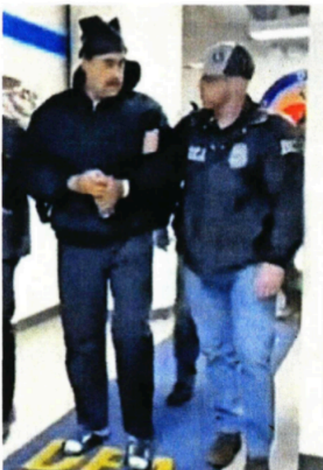
La cuenta oficial de respuesta rápida de la Casa Blanca publicó un video que muestra a Nicolás Maduro en las instalaciones de la DEA en NY. "Feliz Año Nuevo", dice.

Las declaraciones de Trump en la conferencia en la que habló del ataque generaron preocupación. La líder opositora venezolana María Corina Machado llamó a estar "vigilantes" y reclamó que se permita a Edmundo González Urrutia, el candidato que