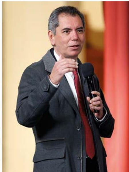
Edgar Amador. El titular de Hacienda, en la presentación del plan de inversión.

“Serán fondos dedicados específicamente al financiamiento de esta estrategia, por lo que serán vehículos muy transparentes y eficientes en sus costos”, enfatizó.