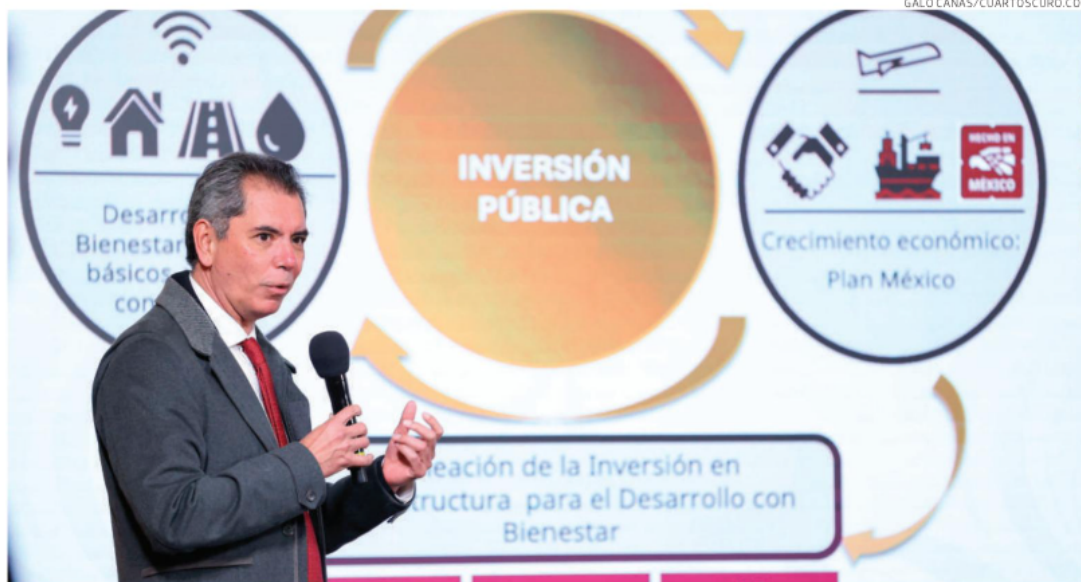
Edgar Amador Zamora, secretario de Hacienda y Crédito Público, durante la conferencia Mañanera del Pueblo.

Amador Zamora subrayó que el portafolio fue definido tras un análisis individual de más de mil 500 proyectos, con el fin de garantizar su sostenibilidad financiera y viabilidad técnica. Asimismo, anunció la creación de un Consejo de Planeación Estratégica de la In-