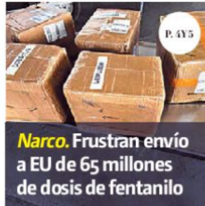
Narco. Frustran envío a EU de 65 millones de dosis de fentanilo