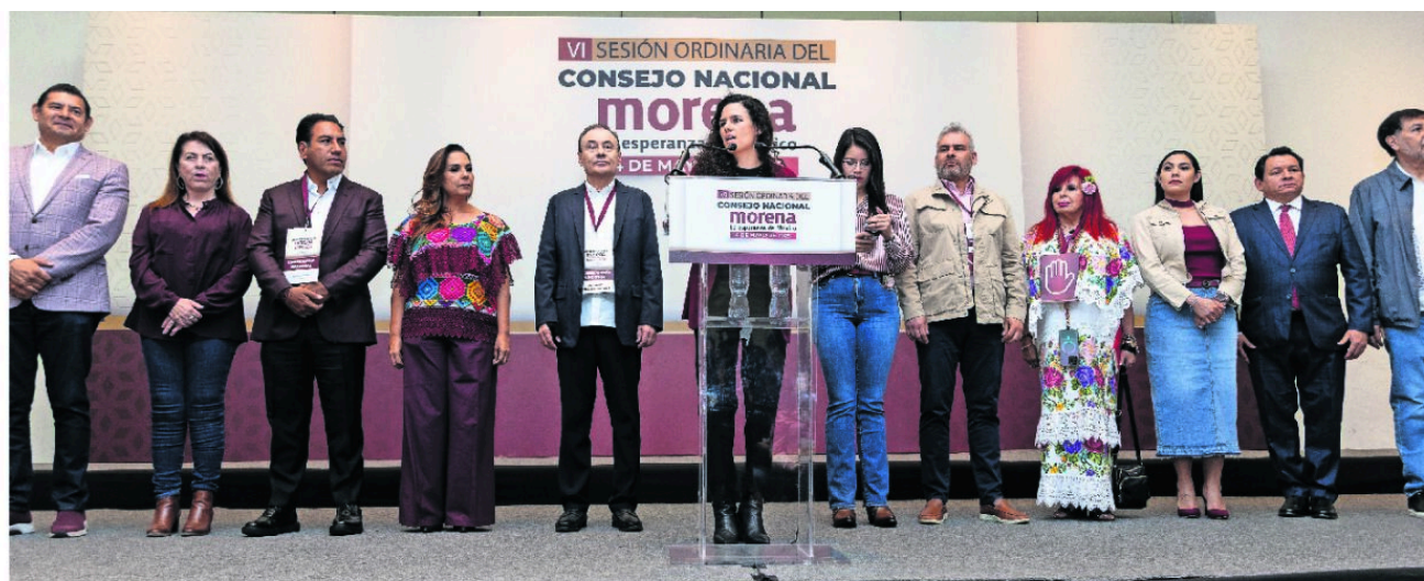
Luisa María Alcalde, dirigente nacional de Morena, dio a conocer los lineamientos de comportamiento para los militantes durante el Consejo Nacional del partido.