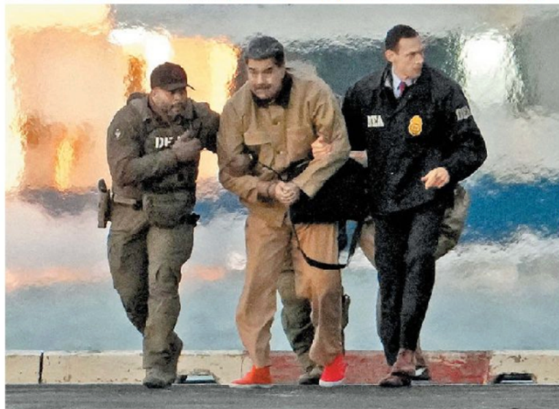
Comparecencia ante el juez Alvin Hellerstein y su traslado previo.