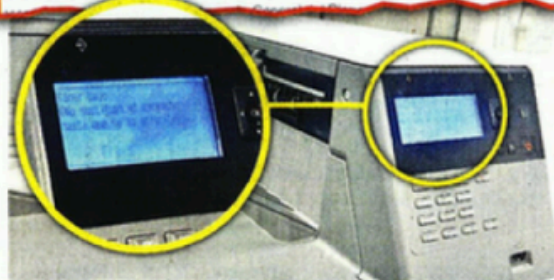
En Monterrey, no pueden imprimir expedientes judiciales, parte esencial de su trabajo, por la falta de tóner y papel.

Julio de amparo exclusivamente. En atención a su solicitud de copias certificadas, al efecto, dígaselo, que este órgano jurisdiccional se encuentra materialmente imposibilitado para expedir las copias que refiere en su escrito de cuenta, lo anterior ante la falta de materiales como lo son tóner, hojas, fotocopadoras e impresoras. Aunado a ello, el centro de copiado que anteriormente operaba en las instalaciones del edificio sede Santa Engracia, donde se encuentra ubicado este Juzgado, ya no se encuentra en funcionamiento. No obstante, lo anterior hágase del conocimiento de la compareciente que