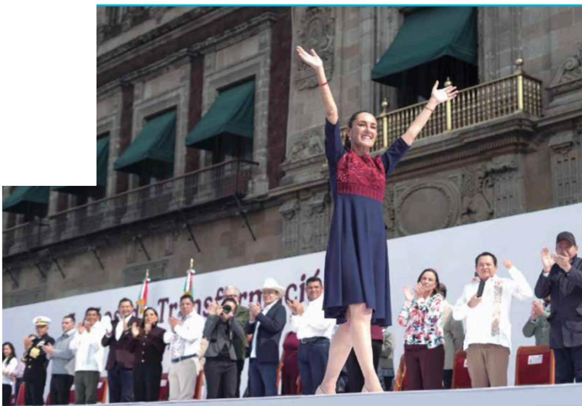
• RESULTADOS. La Presidenta de México recordó que la transformación verdadera no sólo es económica y social, también es ética y moral.

La presidenta Sheinbaum Pardo agradeció el acompañamiento del