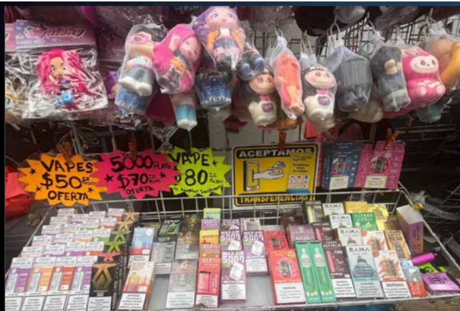
Aunque se han advertido los riesgos para la salud por el uso de vapeadores, la venta continúa de manera indiscriminada.

Los principales problemas a la salud que puede provocar el vapeo