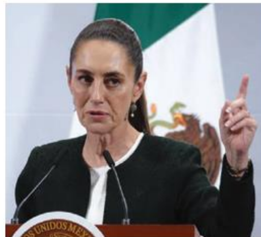
LA PRESIDENTA Claudia Sheinbaum, ayer, en conferencia de prensa.