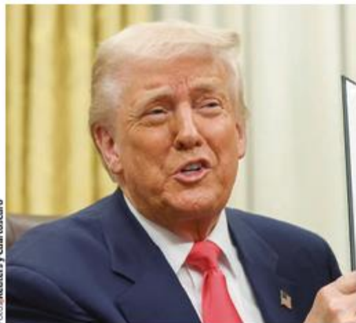
EL PRESIDENTE Trump, ayer, al firmar la orden ejecutiva en el Despacho Oval.

“ LE DIJE: 'Estamos teniendo resultados, presidente Trump. Porque ahora que puso las tarifas, ¿cómo vamos a seguir cooperando, colaborando con algo que daña al pueblo de México?' Y no fue ni amenaza, nada"