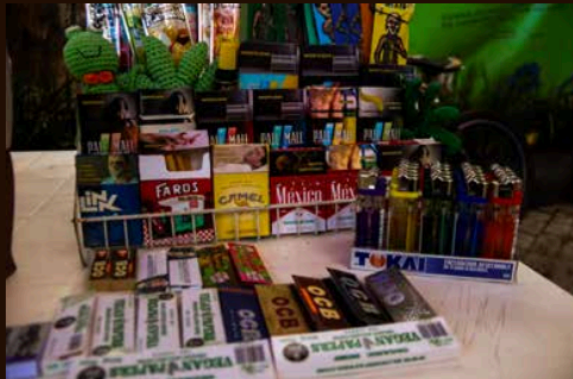
Dos de cada 10 cigarros que se consumen en México provienen del mercado negro.

El auge del consumo de vapeadores y el crecimiento acelerado del mercado negro del tabaco fortalece su presencia en al menos 16 estados del país