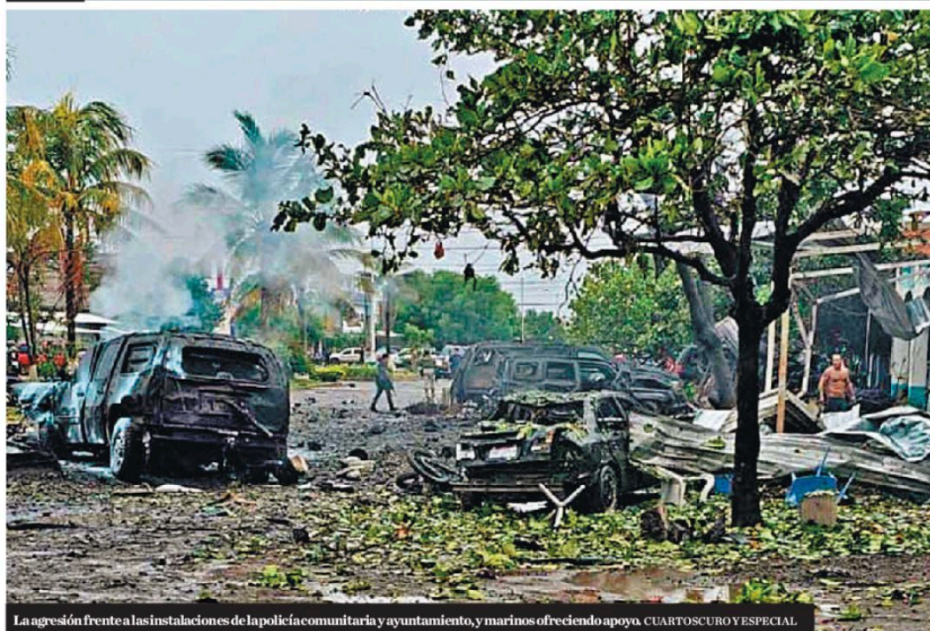
La agresión frente a las instalaciones de la policía comunitaria y ayuntamiento, y marinos ofreciendo apoyo.