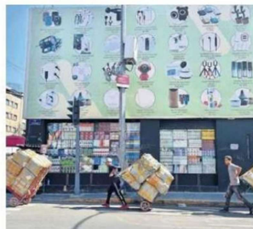
Productos provenientes de Asia y de otras partes del mundo tendrán un aumento en aranceles, y en algunos otros serán nuevos con la reforma de los diputados.