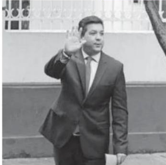
Francisco García Cabeza de Vaca