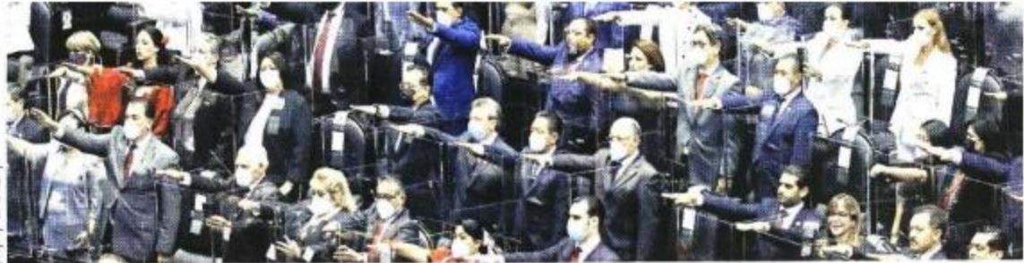
El mayor avance en la paridad de género se ha registrado en el Congreso federal y en los estatales.