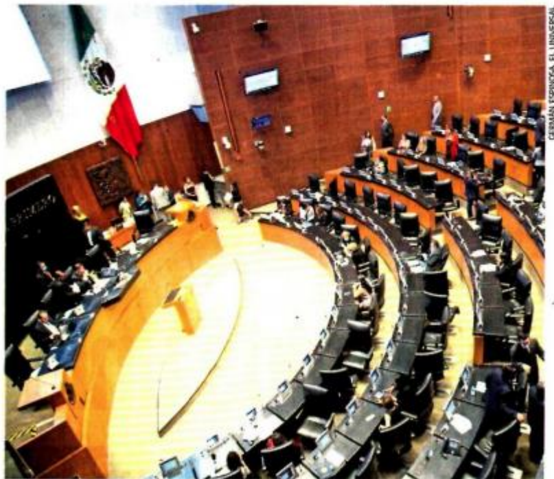
En la sesión ordinaria del Senado se aprobaron por unanimidad diversas reformas en favor de los derechos de niñas, niños y adolescentes.

También se aprobó una reforma que busca inhibir la explotación de niños en México en labores de mendicidad.