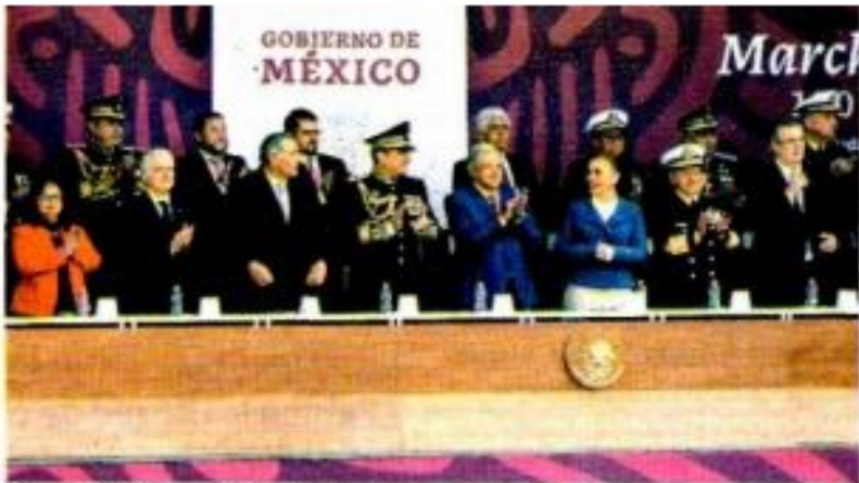
La ministra, en el estrado. ARACELI LÓPEZ