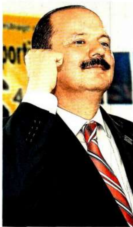
En su regreso a México, César Duarte será juzgado por peculado y enriquecimiento ilícito por el probable desvío de 96 millones de pesos.

EMPRESAS FANTASMA simularon servicios inexistentes en Chihuahua entre 2014 y 2016.