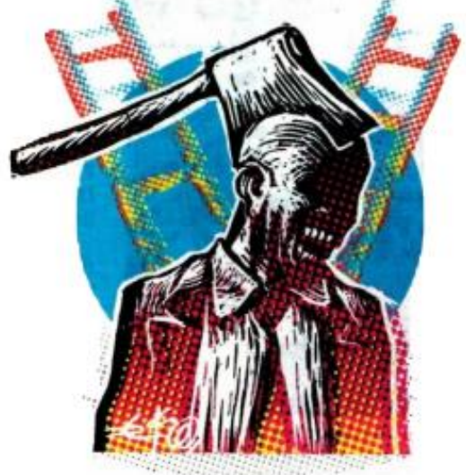
El partido que AMLO creyó más débil, se puede volver su peor pesadilla.

rena. Si el presidente creyó que con el PAN, se equivocó y tal a los priistas los iba a convencer vez no supo llegarles al precio. con cortejos políticos y amena- Y ahora, el partido que creyó zas de "traición a la patria", pa- más débil se puede volver su ra romper sus pactos y alianzas peor enemigo y pesadilla. ●