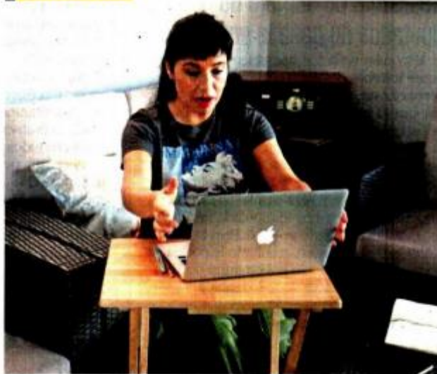
DEIGO SIMÓN SÁNCHEZ, EL UNIVERSAL