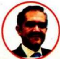
MIGUEL ÁNGEL MANCERA