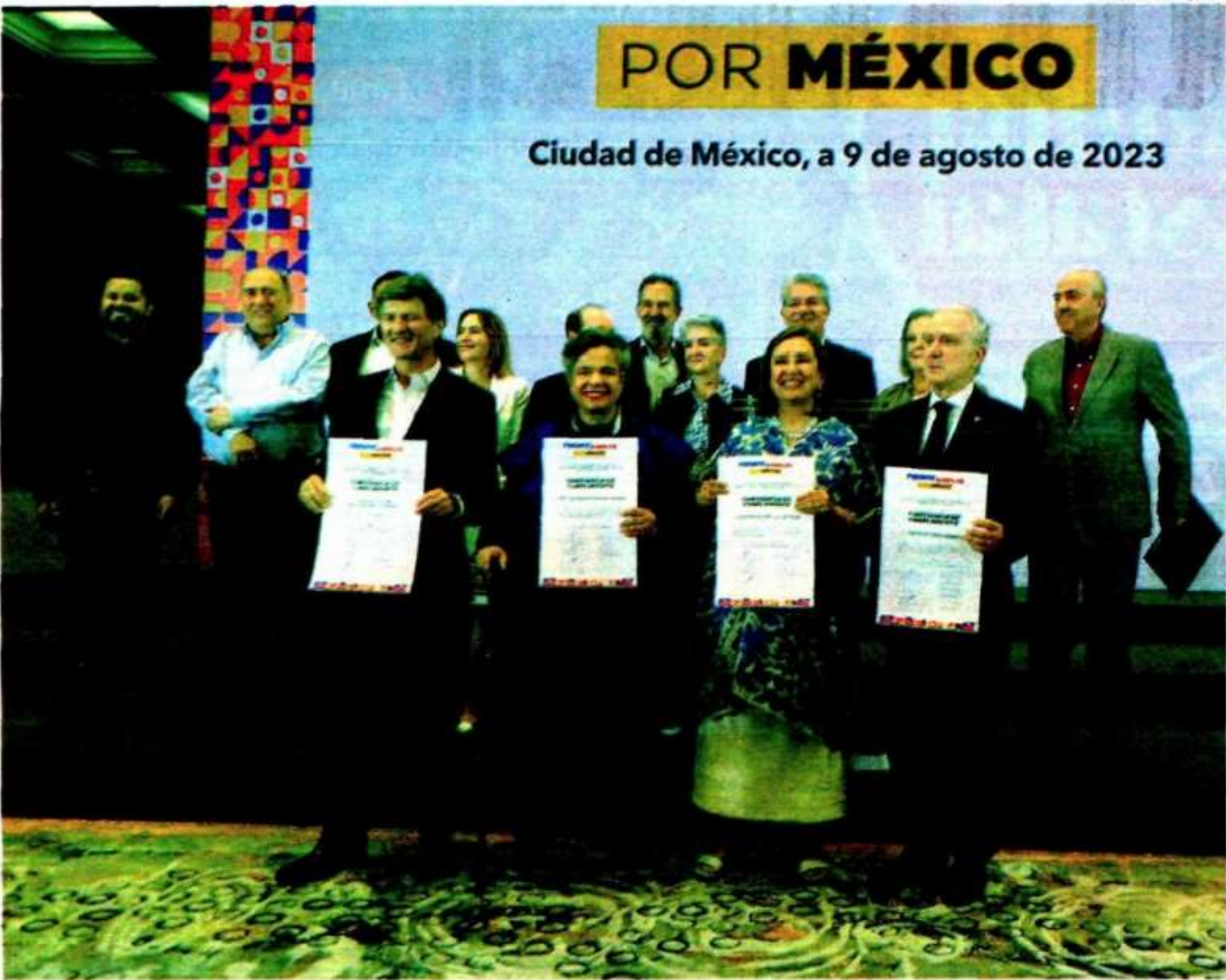
Los aspirantes recibieron sus constancias que les permiten participar en la segunda ronda