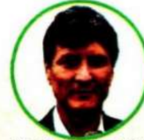
ENRIQUE DE LA MADRID