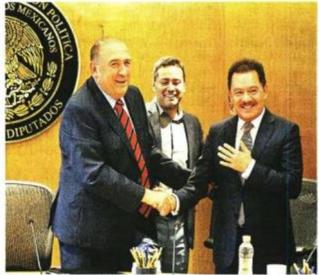
■ Rubén Moreira, diputado del PRI, deja la presidencia de la Jucopo y la asume el morenista Ignacio Mier (der.).

"Lo haré preservando el interés general por encima de los intereses partidistas o particulares; les pido a todos que colaboremos para el mejor desempeño de esta Cámara", planteó.