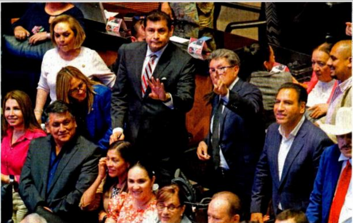
El senador Ricardo Monreal mostró todas sus habilidades políticas y, pese a las críticas de sus compañeros de bancada conocidos como "radicales" por su lejanía con el presidente López Obrador, revirtió el marcador y logró operar a favor de Alejandro Armenta para que presida la Cámara Alta.