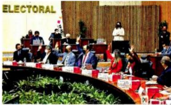
■ El INE inició ayer el conteo de votos y hoy dará los resultados definitivos.