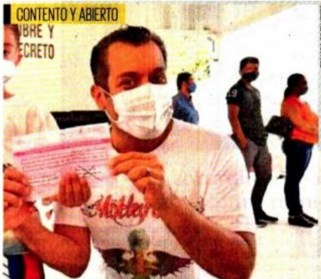
El secretario de Relaciones Exteriores, Marcelo Ebrard, acudió a su casilla; antes, llamó a votar.