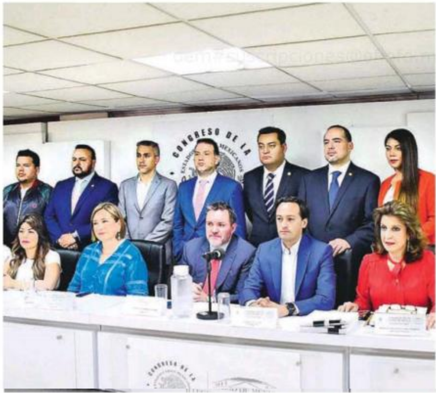
Conferencia de prensa ofrecida en las instalaciones del Congreso capitalino

Lo que estamos planteando es que se investigue y castigue a los responsables del colapso de la Línea I2. ¿Quién no hizo su trabajo, quién es el responsable del mal diseño, quién es el responsable de la construcción con problemas?"