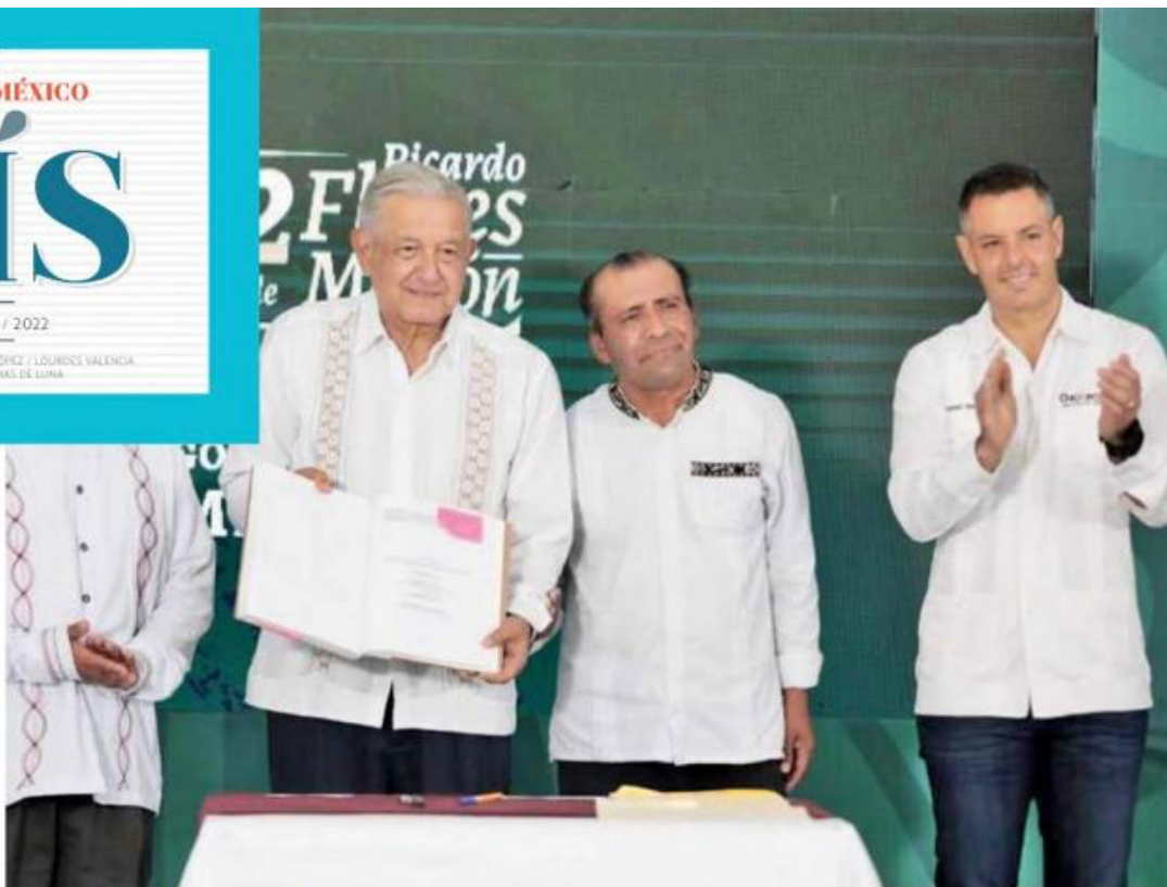
APOYOS | El presidente López Obrador se comprometió en Oaxaca a ayudar de manera directa a los afectados del huracán Agatha.

UATULCO, Oaxaca. El gobierno del presidente Andrés Manuel López Obrador rescató de la quiebra a la empresa de internet Altán Redes, con la que pretende comunicar todo el territorio nacional. Se trata de la compra de la mayoría de acciones de esta empresa en crisis financiera y operativa que consiguió su concesión en la administración pasada, pero no pudo consolidar su propósito de conectividad de internet al país.