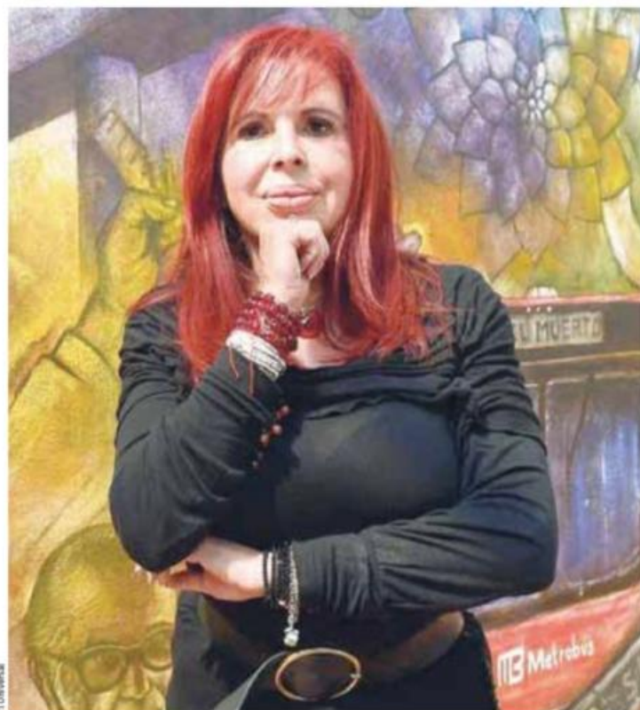
Sansores | Revelaciones.