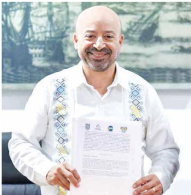
Sales Heredia | Cateos.