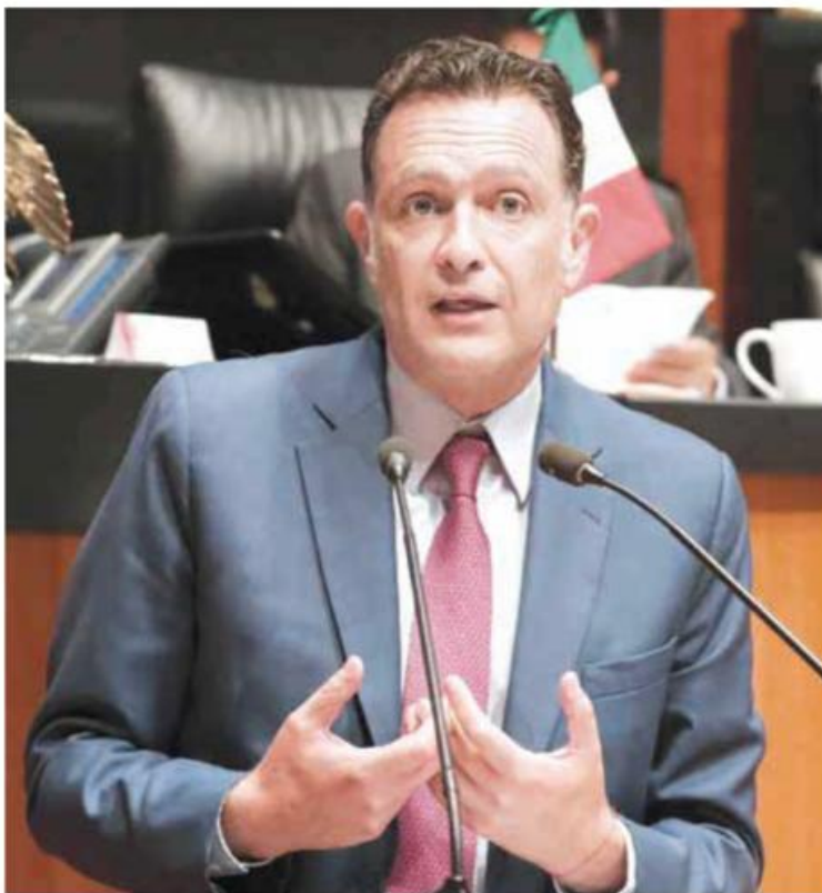
Kuri | El PRI faltó a su palabra.

"en bloque" a aquellas iniciativas emanadas de los partidos del régimen (Morena, PVEM, PT) o del Ejecutivo federal con las que no estuvieran de acuerdo.