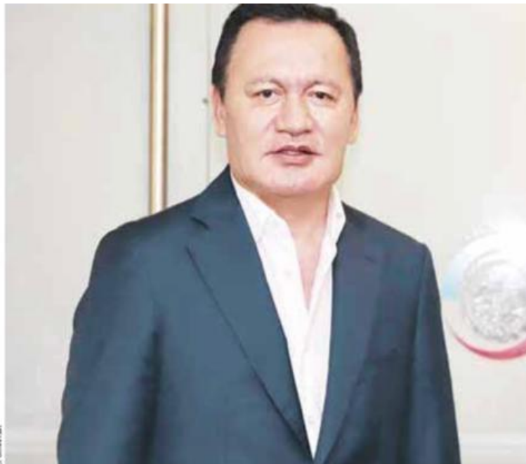
Osorio | Moreno "incumplió"

En lo que respecta a las gubernaturas, Va por México solo obtuvo dos triunfos, pero en la Cámara