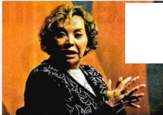
Elba Esther Gordillo cuestiona la política educativa de la 4T.

“¡No! Fui poder real, y de frente. Yo no fui líder moral nunca, siempre busqué la legitimación en los estatutos”, zanja.