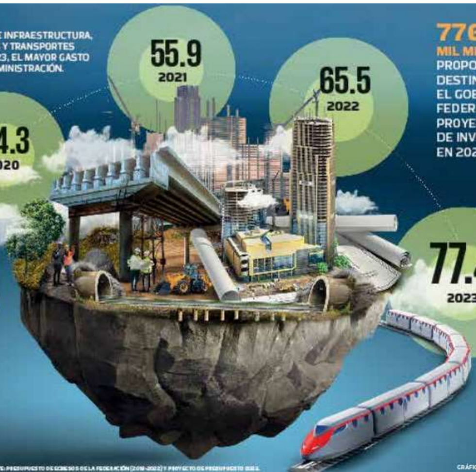
GRÁFICO: ARTURO RAMÍREZ