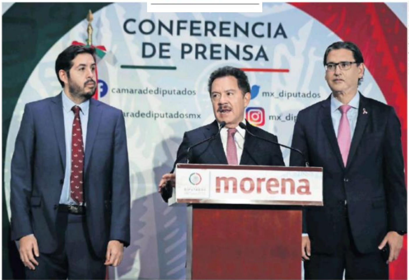
DE CO SIMÓN SÁNCHEZ EL UNIVERSAL

"Estamos hablando de los montos aprobados en los ramos autónomos. Entre todos tienen una solicitud de 173 mil millones de pesos para el presupuesto del próximo año"