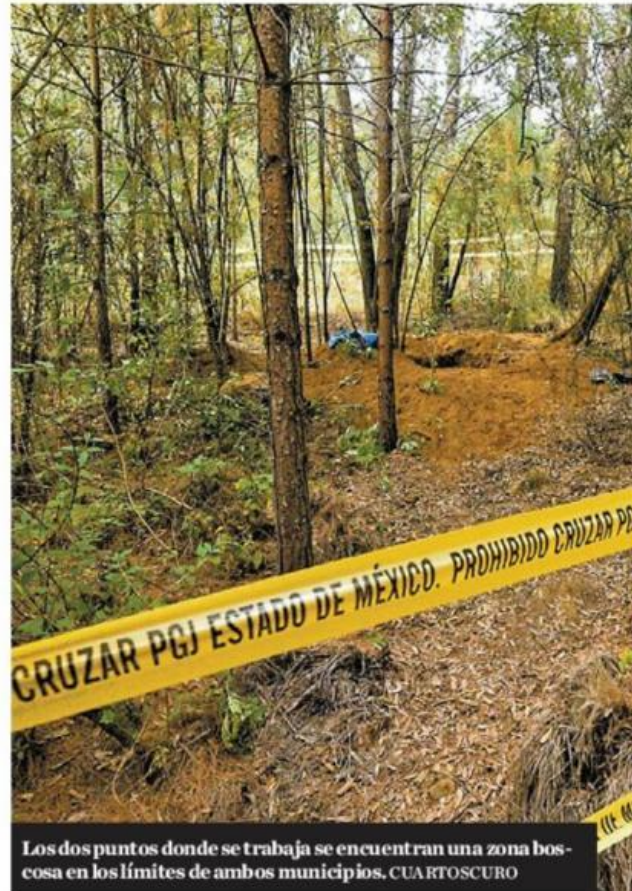
Los dos puntos donde se trabaja se encuentran una zona boscosa en los límites de ambos municipios

"Ayer fue lo más feo, pasaron muchas patrullas y soldados, hasta hicieron como retenes", comentó una de las vecinas de San Juan Coapanoaya.