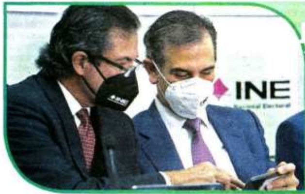
■ Lorenzo Córdova terminará en abril su periodo en el INE.

El Magistrado Vargas ocupó la presidencia del TEPJF entre 2020 y 2021 y su renuncia, luego de una crisis institucional interna, dio paso a una elección posterior que culminó con la presidencia del actual Magistrado Reyes Rodríguez .