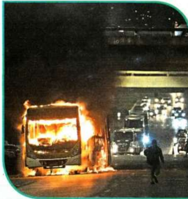
Tras el triunfo de Lula, simpatizantes de Bolsonaro se manifestaron de manera violenta en varias ciudades de Brasil.