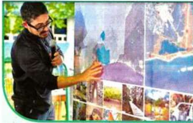
El Ateneo Peninsular y nuevas Áreas Naturales Protegidas, como el Parque del Jaguar, fueron beneficiadas con inversiones.