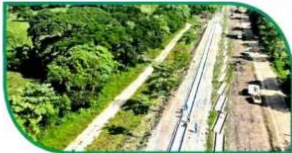
Los trabajos en el Istmo registran rezagos considerables.