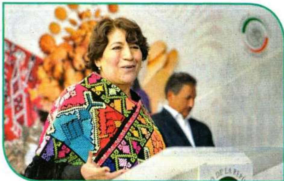
Tornada de edelfinagomez