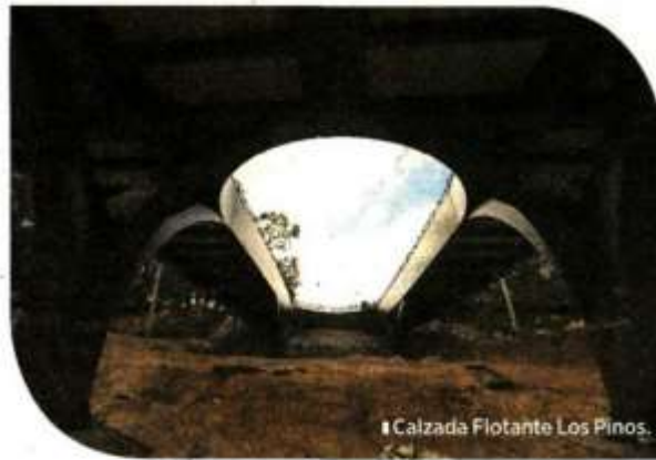
Calzada Flotante Los Pinos.