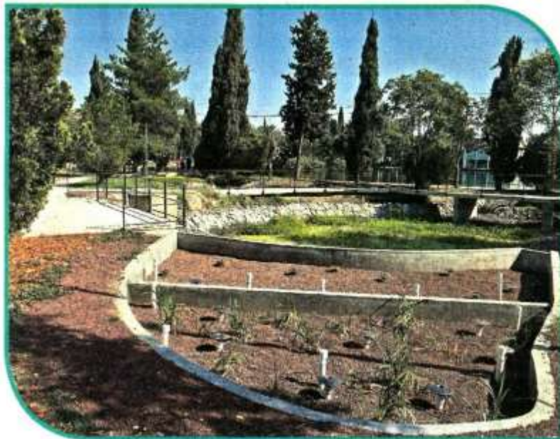
■ Humedal construido en la Segunda Sección del Bosque.

A menos de dos años de que termine el sexenio, Chapultepec, Naturaleza y Cultura seguirá avanzando este 2023 con su cuantiosa bolsa de recursos, pero entre reclamos. ■