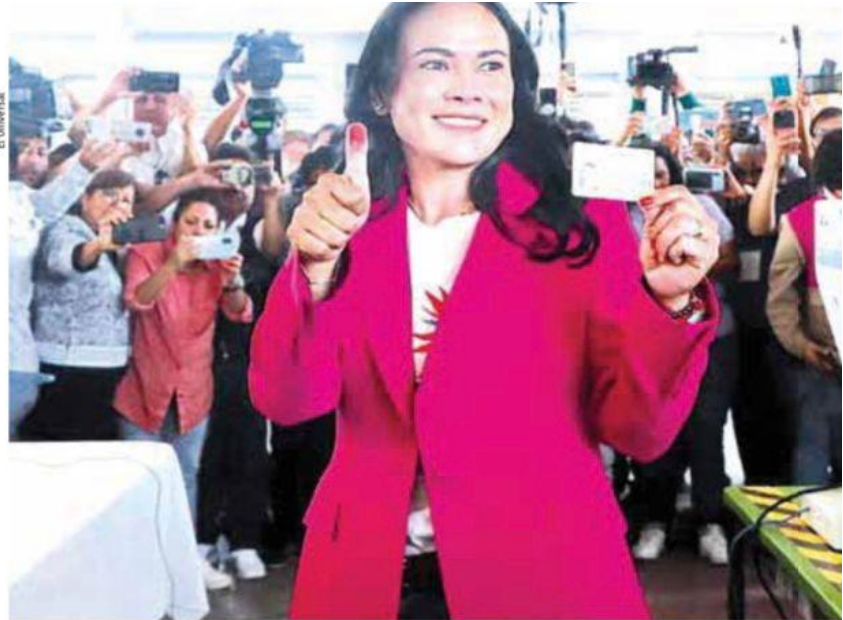
Del Moral | Adiós PRI.

Una a una, desde 2018 y hasta 2023, Morena y sus aliados han venido arrebatando gobiernos estatales a prácticamente todos los partidos políticos hasta llegar