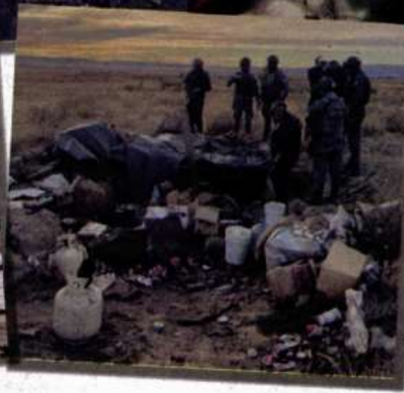
En Chihuahua, Zacatecas y Jalisco han destruido campamentos con armas y vehículos blindados.