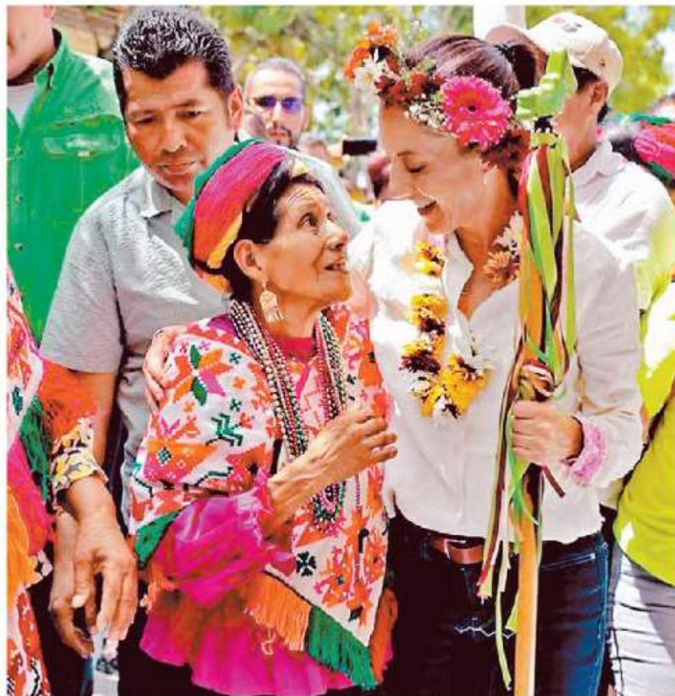
La aspirante conversó con agricultores y ganaderos en el municipio de Ébano, SLP.