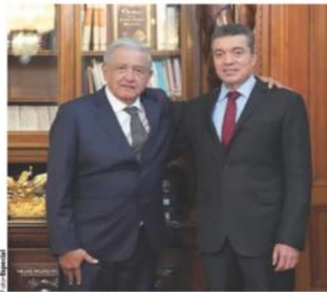
EL PRESIDENTE López Obrador, con el gobernador de Chiapas, Rutilio Escandón, en imagen de archivo.

EL PRESIDENTE propondrá que baje el porcentaje de asistencia ciudadana en la consulta de revocación para que sea vinculante; en reforma prevé sistema de sufragio electrónico