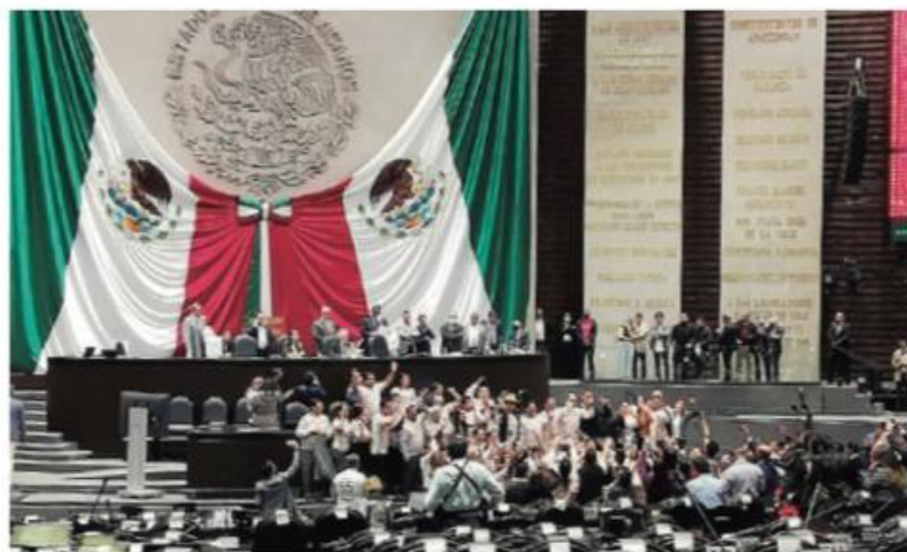
EL PLENO de la Cámara de Diputados durante la votación del PEF, este viernes.

SE CONFRONTAN en debate por legisladora panista que dio su discurso en la tribuna con su hija en brazos; total de recorte a órganos autónomos crece a 7.4 mil millones de pesos