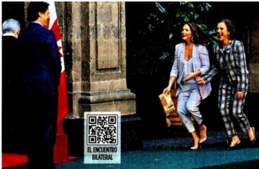
EFFECTO TRUDEAU. Sophie Grégoire y Beatriz Gutiérrez corren para alcanzar a sus esposos durante la reunión bilateral México-Canadá que se efectuó ayer en Palacio Nacional.

López Obrador refirió que, previo a la bilateral, también dialogó con Trudeau sobre las empresas mineras que tienen inversiones en México y, en particular, sobre la importancia de la empresa TransCanada, que firmó un contrato con la Comisión Federal de Electricidad (CFE) para la construcción de un gasoducto.