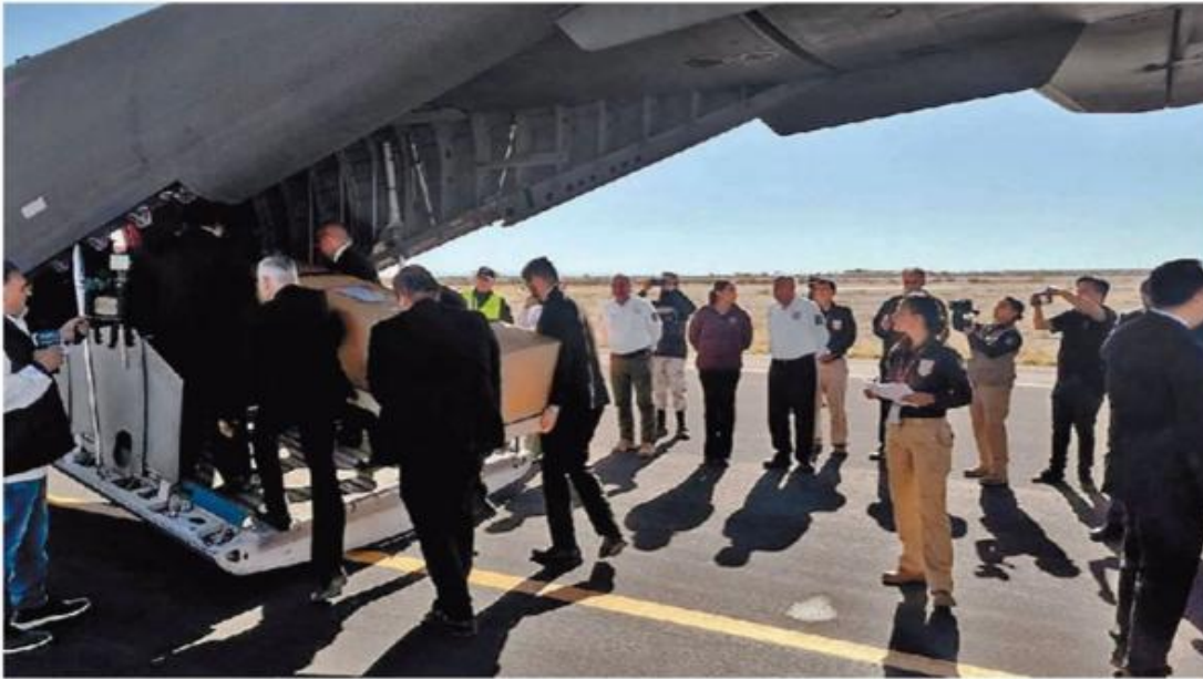
Cuerpos de hondureños y guatemaltecos fueron trasladados ayer a bordo de un avión de la Fuerza Aérea Mexicana.