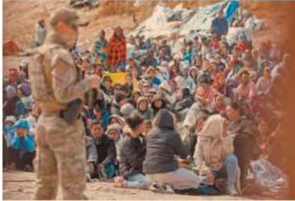
La Patrulla Fronteriza se ocupa de un gran grupo de migrantes que se han reunido entre las vallas primaria y secundaria.

De 468,499 casos, del 2013 a abril pasado, se han resuelto 147,131