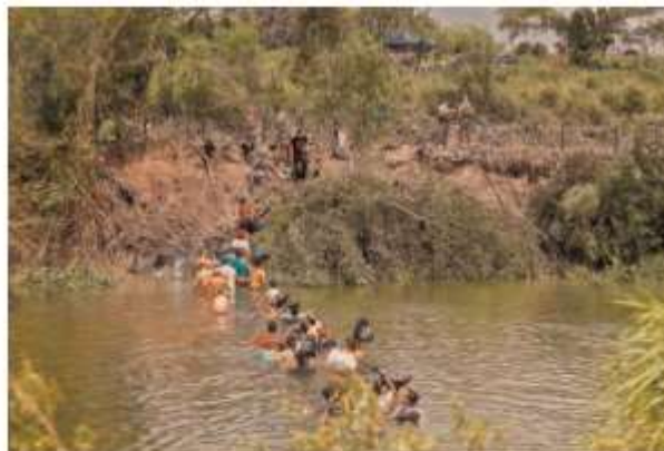
Migrantes cruzan el Río Bravo para entregarse a la Patrulla Fronteriza de los EU antes del levantamiento del Título 42.