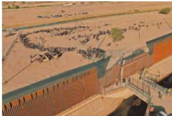
Cientos de migrantes se ponen bajo el resguardo de las autoridades estadounidenses para comenzar un procedimiento de asilo.