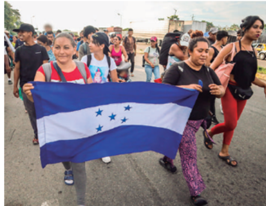
EL JUEVES, hondureños iniciaron una caravana en Chiapas.